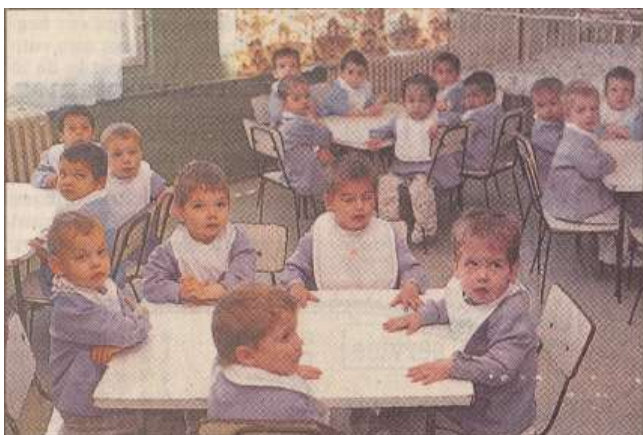
Barn på barnehjemmet i Onesti venter på mat. Det ville ikke vært i Norge at så mange barn var samlet, uten å gi fra seg en lyd.

Barna var glade og fornøyde og noen fikk også tilbud om arbeid utenfor barnehjemmet.