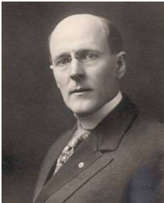
Paul Percy Harris

Det var fordi Chicago på begynnelsen av 1900-tallet var preget av omfattende kriminalitet og korrupsjon at Paul Harris ønsket å skape en motbevegelse som bygget på de verdiene som preget hans oppvekst. Lokalt der han bodde og arbeidet var det mange forskjellige bedrifter, og det var der han fikk idéen til å etablere en klubb for mennesker fra vidt forskjellige yrker og bransjer. I starten var de fire menn fra helt forskjellige miljøer. En var nordamerikansk, en var tysk, en svensk og en hadde irsk opprinnelse. De var av protestantisk, romersk-katolsk og jødisk tro. En var skredder, én gruveingeniør, én kullhandler og én advokat. Som innflyttere hadde de samme behov for et vennskapelig miljø, og for gjensidig inspirasjon og støtte.