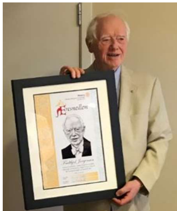
Hedret på presidentskiftet den 21. juni 2017