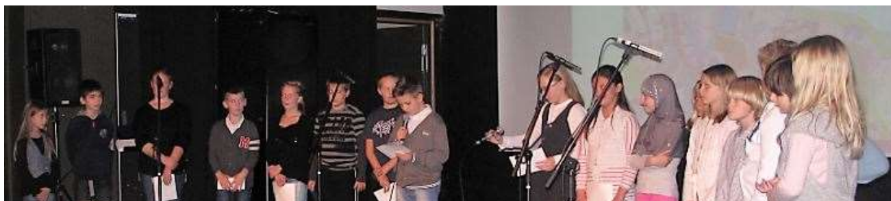
På filmvisningene har ofte barn underholdt på kulturhistoriske filmaftener. Her elever fra Hønefoss skole