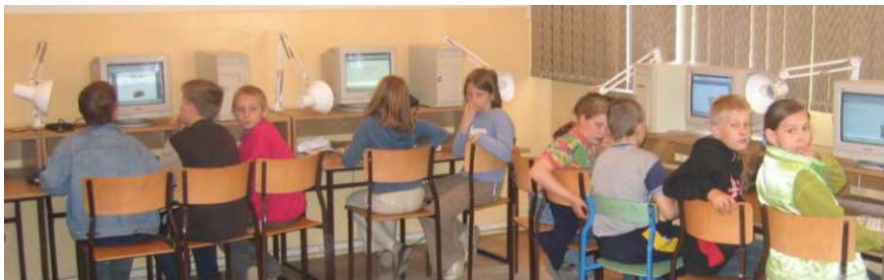
Ivrige elever på barneskolen i Zlocieniec prøver de «nye» datamaskinene.