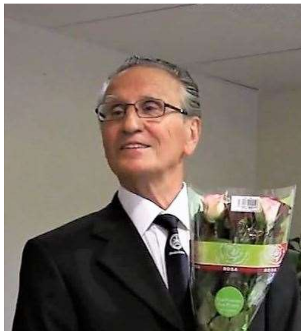
Hedret på presidentskiftet den 15. juni 2016